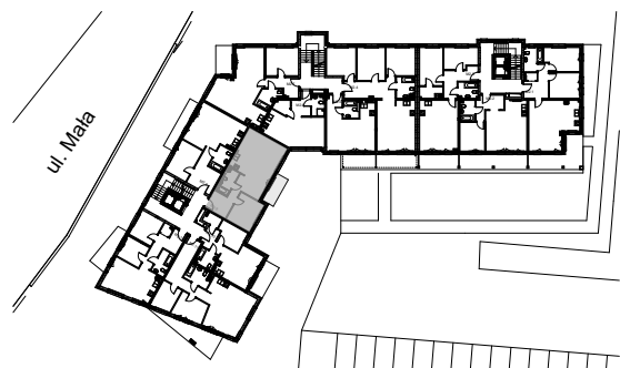
SCHEMAT LOKALIZACJI MIESZKANIA W BUDYNKU