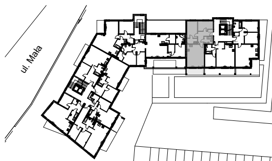
SCHEMAT LOKALIZACJI MIESZKANIA W BUDYNKU